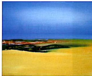
Hinrich Schüler, „Abstrakte Landschaften“, Acryl auf Leinwand, Nessel oder Jute.