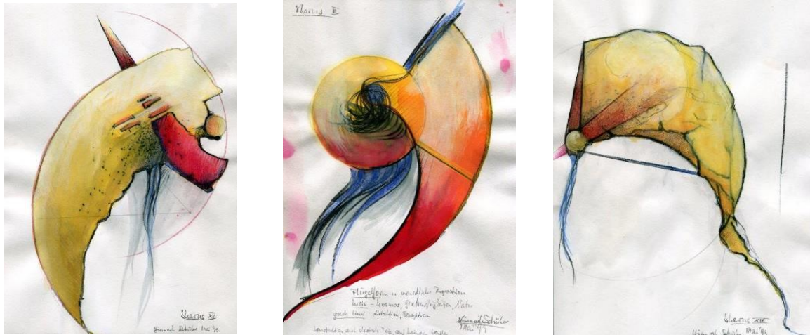
Kompositionen: Hinrich JW Schüler

Wer seiner Kreativität Fundament, Struktur und Ziel geben möchte, kann hier vom Profi lernen. Kenntnisse von den Grundlagen der Ästhetik ersparen Mühe, Zeit- und Materialverlust. Wie baue ich ein Bild auf? Womit beginne ich? Wie lege ich ein dynamisches Gleichgewicht der Kräfte an? Wodurch bringe ich Bewegung und Spannung ins Werk? Wie verändere ich den Eindruck von Raum und Bildtiefe durch Anlage von Fluchtpunkt und Horizont? Wie und wodurch verändern Farb- und Formgestaltung den Ausdruck?