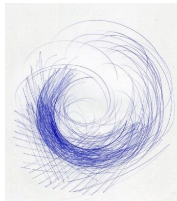
Kompositionen: Hinrich JW Schüler