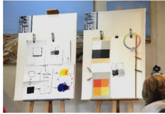
Hinrich Schüler erläutert die Wirkung von Farben und gibt Hinweise zum Bildaufbau