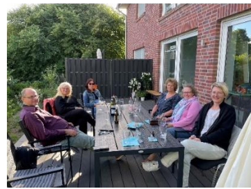
Atelier und Kursleben